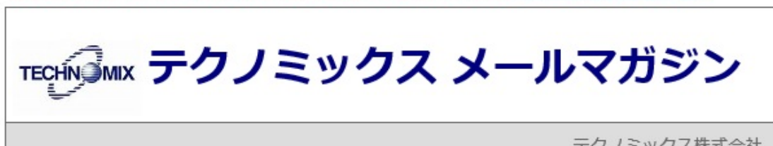
図 メール上部に記載のリンクをクリックする方法

画像が表示されない場合はメールソフトから「画像をダウンロード」をクリックするか こちらをクリックしてください